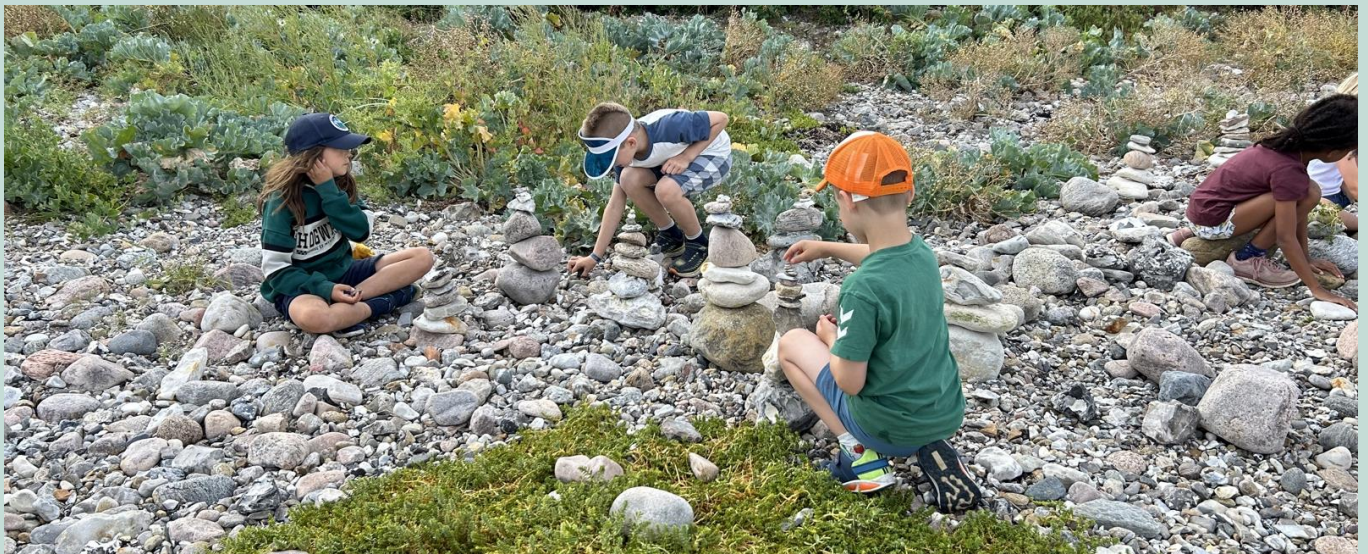
SFO sommerkoloni ved Skamlebæk sommer 2024