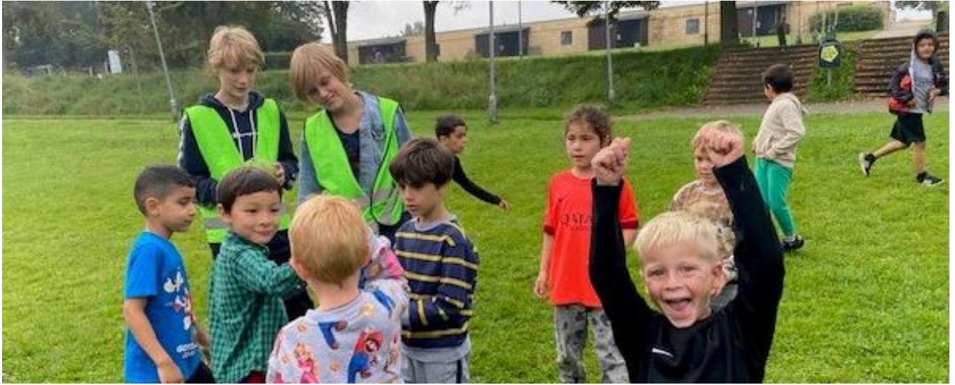
Legepladsen og elever fra legepatruljen 2024