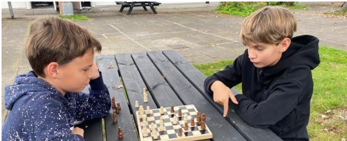
Frikvarter kan også være en stille stund med skakbrættet